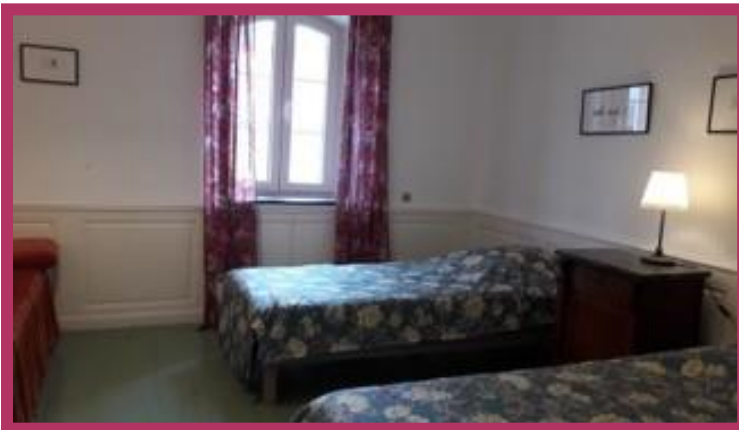
Chambre deux lits simples : « Vue sur cour » - 90€/nuît, 2 nuits minimum