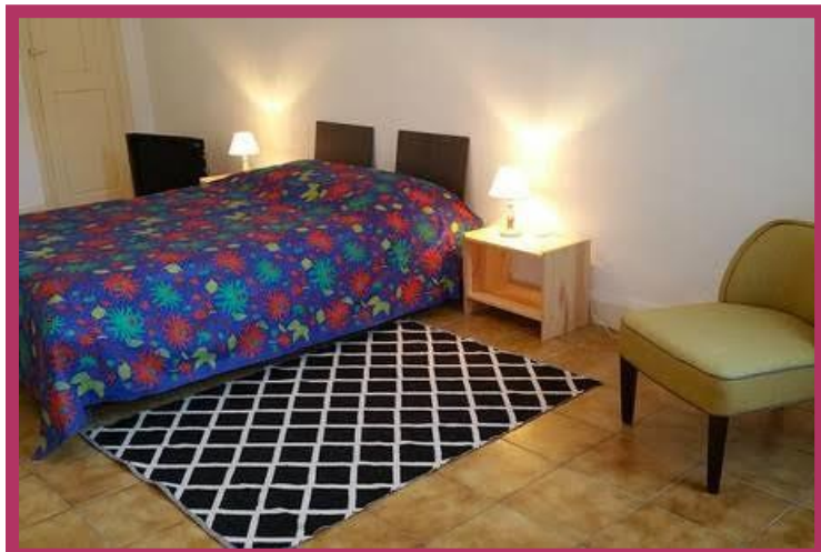
Chambre lit double plus un lit simple : « Chambre au Château » - 120€/nuît, 2 nuits minimum