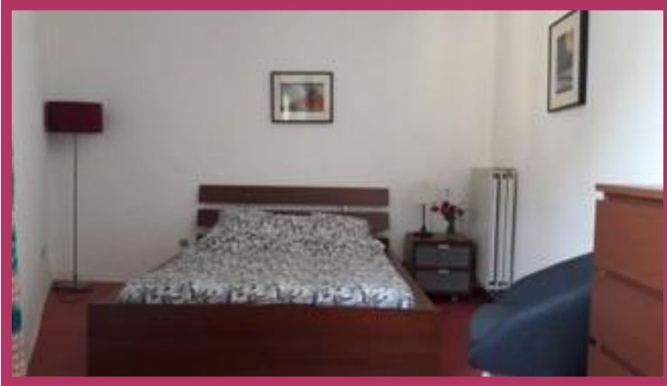
Chambre double : « Chambre au calme » - 90€/nuît, 2 nuits minimum

Dans les communs du Château, trois chambres ont été fraîchement rénovées. D'un style simple mais élégant, elles permettent d'accueillir 7 personnes au total dans l'enceinte du domaine, au plus proche de votre événement.