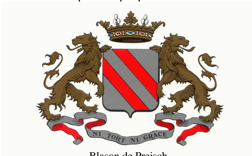
Blason de Preisch

Après avoir observé les différents blasons pendant la visite du château, en particulier celui de la famille De Gargan et celui de Preisch, les enfants pourront créer leur propre blason ainsi que leur propre devise.